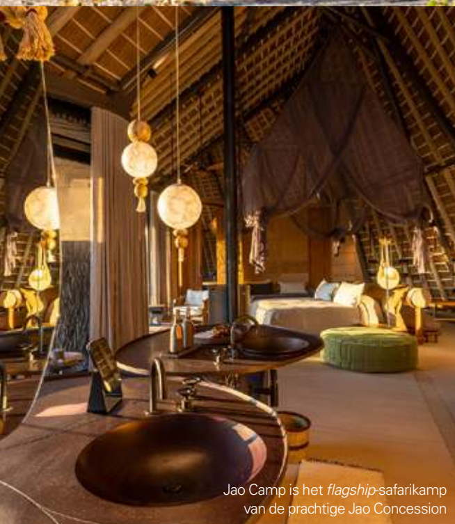
Jao Camp is het flagship -safari-kamp van de prachtige Jao Concession