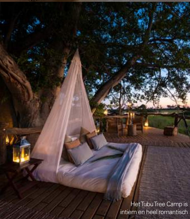
Het Tubu Tree Camp is intiem en heel romantisch