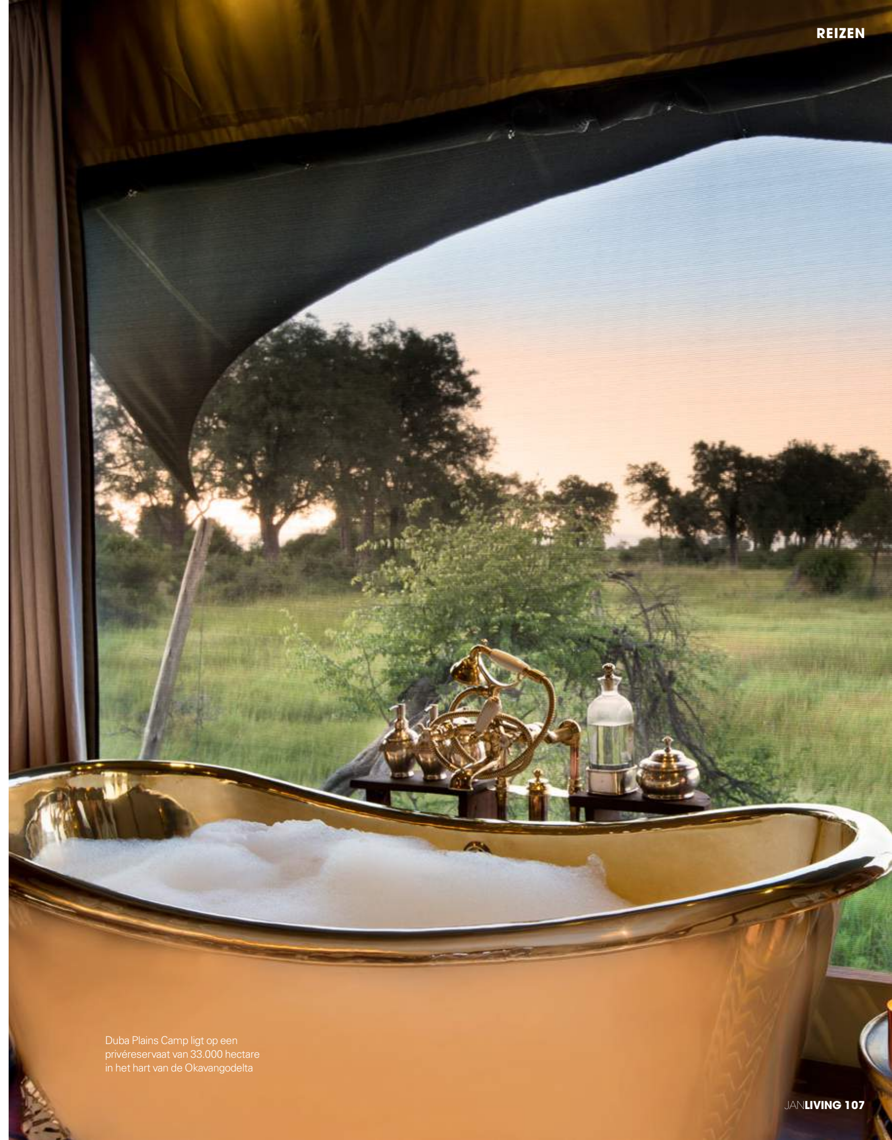
Duba Plains Camp ligt op een privéreservaat van 33.000 hectare in het hart van de Okavangodelta