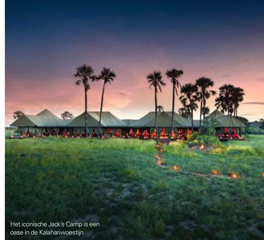
Het iconische Jack's Camp is een oase in de Kalahariwoestijn

TEKST TITM VAN ERP