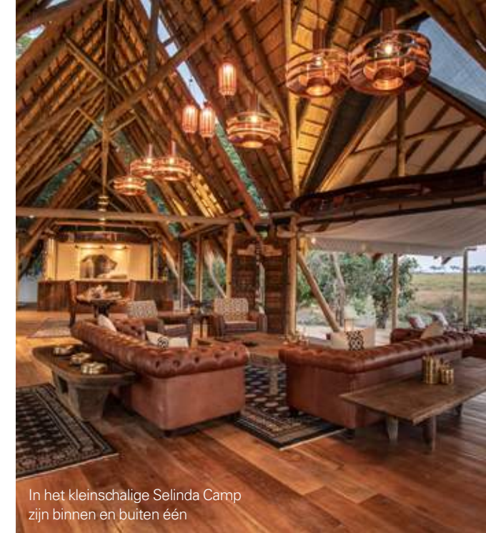
In het kleinschalige Selinda Camp zijn binnen en buiten één

Een safari-ervaring in Botswana is niet alleen intensief, maar ook exclusief. ‘Als in Botswana ergens vier safariauto’s op één plek staan om naar een leeuw te kijken, is dat ongekend druk. Zelfs op een plek als Maun, de safarihoofdstad van het land, word je niet door toeristen onder de voet gelopen.’ ►