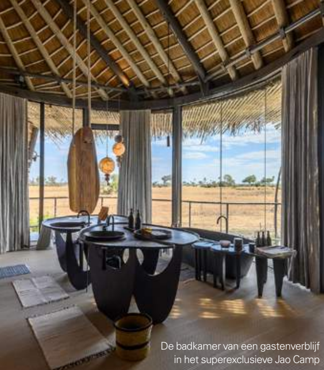
De badkamer van een gastenverblijf in het superexclusieve Jao Camp