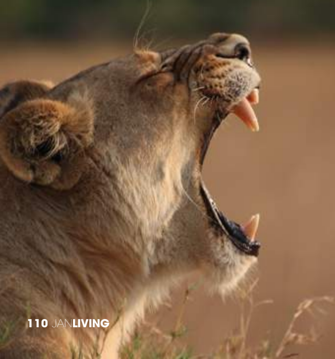
Op safari bij Stanley's Sanctuary Camp